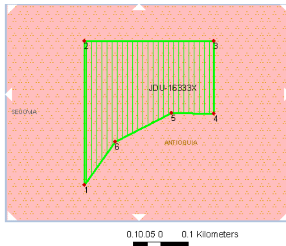
Gráfica N°2 Ubicación geográfica del área de interés

Esta área corresponde al polígono que representa en el siguiente gráfico y se ubica geográficamente así: