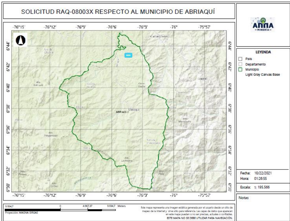
Gráfica N°2 Ubicación geográfica del área de interés

El área está ubicada en las veredas La Antigua, y Santa Teresa del municipio de ABRIAQUÍ , Departamento de Antioquia , como se muestra en el gráfico N°2: