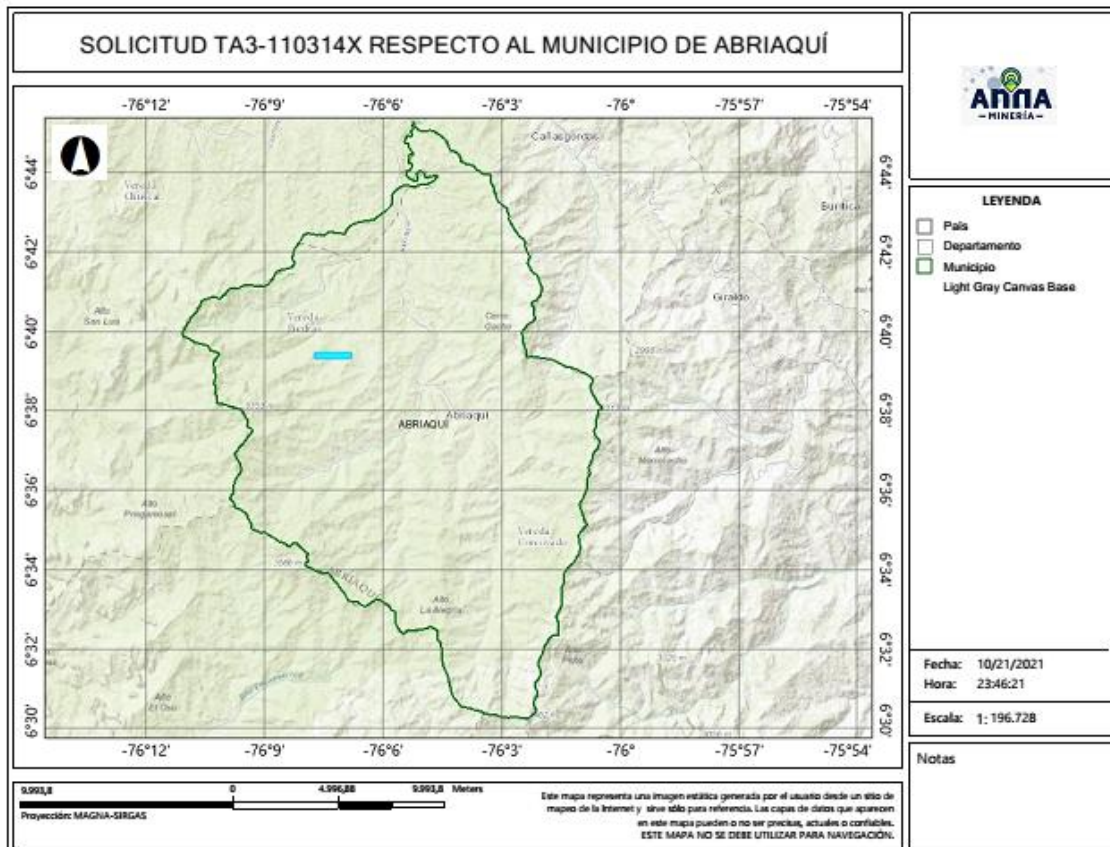
Gráfica N°2 Ubicación geográfica del área de interés

El área está ubicada en la vereda Piedras del municipio de ABRIAQUÍ Departamento de Antioquia , como se muestra en el gráfico N°2: