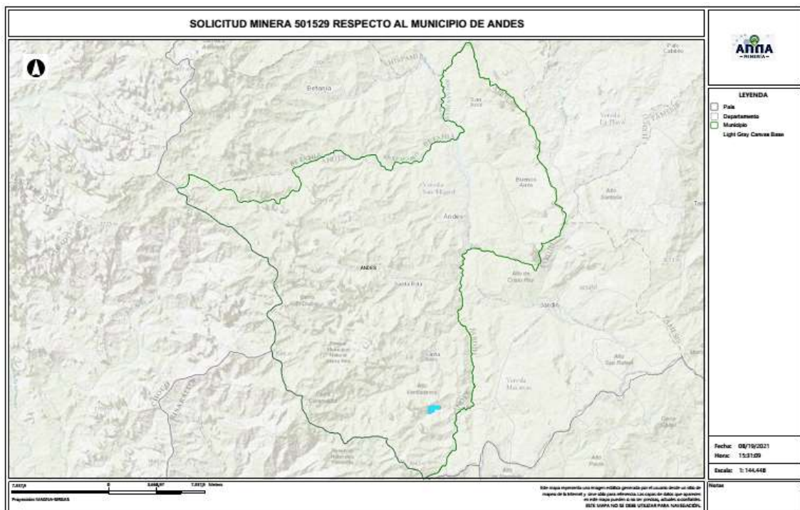
Gráfico N°2 Ubicación geográfica del área de interés

El área está ubicada en la vereda La Cristalina , del municipio de ANDES , Departamento de Antioquia , como se muestra en el gráfico N°2: