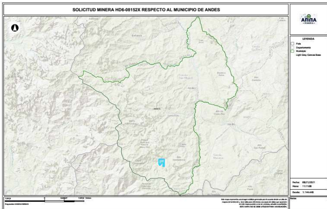
Gráfico N°2 Ubicación geográfica del área de interés

El área está ubicada en las veredas Santa Isabel y Reserva Forestal del municipio de ANDES Departamento de Antioquia , como se muestra en el gráfico N°2: