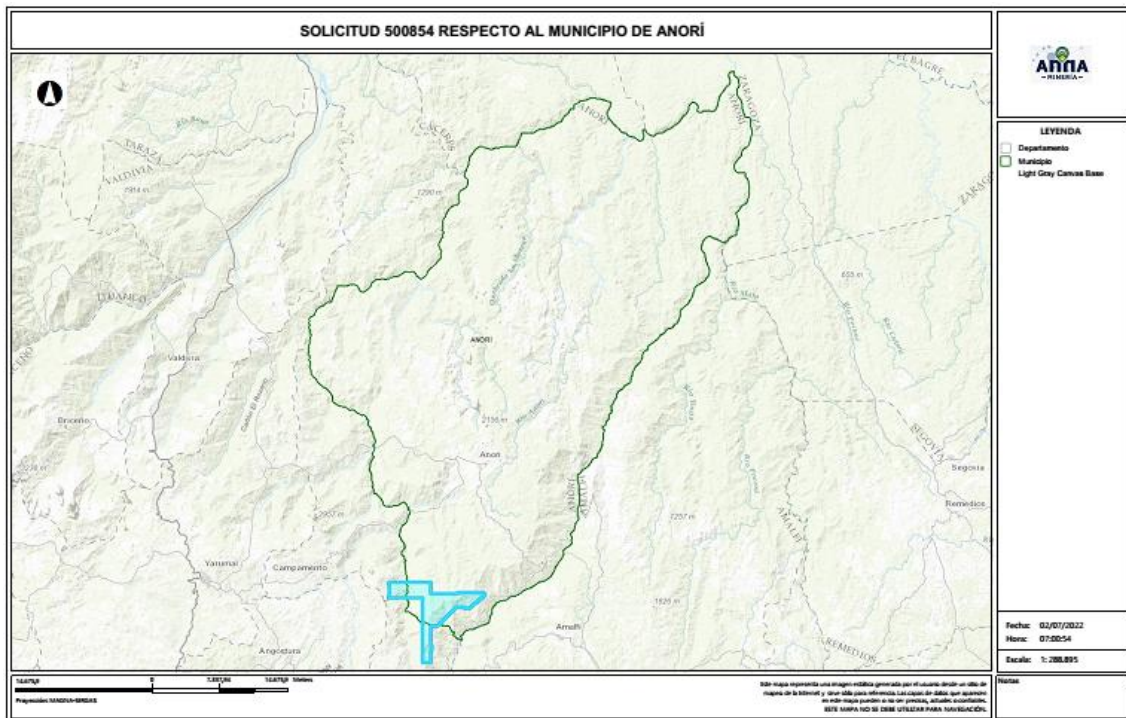
Gráfico N°2 Ubicación geográfica del área de interés

El área está ubicada en las veredas San Juan, Medias Faldas, Montefrío, La Irlanda, San Pablo Caney, La Casita, Malabrido, Chaquiral, El Limón, Pajonal y Marrón , de los municipios de ANORÍ, CAMPAMENTO Y GUADALUPE Departamento de Antioquia , como se muestra en el gráfico N°2: