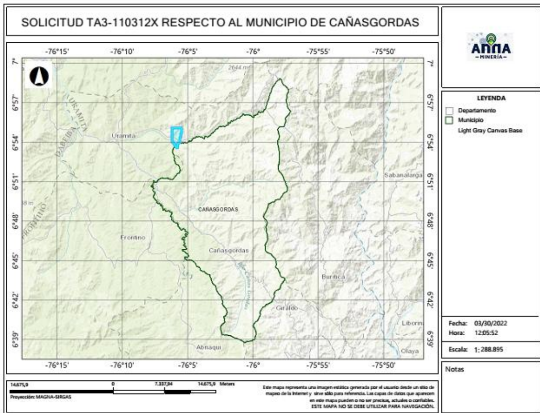
Gráfica N°2 Ubicación geográfica del área de interés

El área está ubicada en las veredas Balcón, San Miguel, Chontadural y Limón Chupadero de los municipios de CAÑASGORDAS Y URAMITA Departamento de Antioquia , como se muestra en el gráfico N°2: