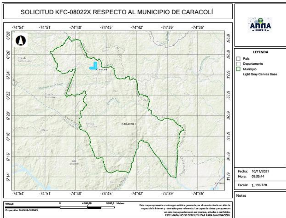
Gráfica N°2 Ubicación geográfica del área de interés

El área está ubicada en las veredas Cascarón y El 62 del municipio de CARACOLÍ Departamento de Antioquia , como se muestra en el gráfico N°2: