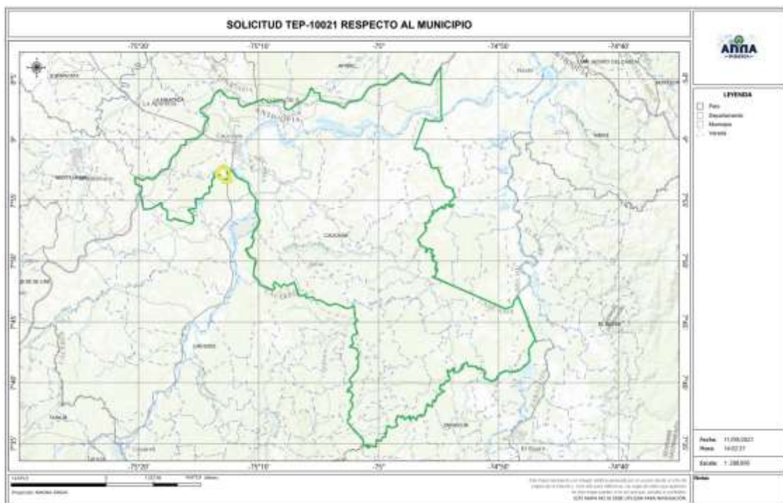
Gráfica N°2 Ubicación geográfica del área de interés

El área está ubicada en las veredas EL MAN del municipio de CAUCASIA y RIO MAN del municipio de CÁCERES del Departamento de Antioquia , como se muestra en el gráfico N°2: