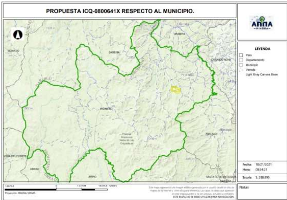
Gráfica N°2 Ubicación geográfica del área de interés

El área está ubicada en la vereda MUSINGUITA del municipio de FRONTINO del Departamento de Antioquia , como se muestra en el gráfico N°2: