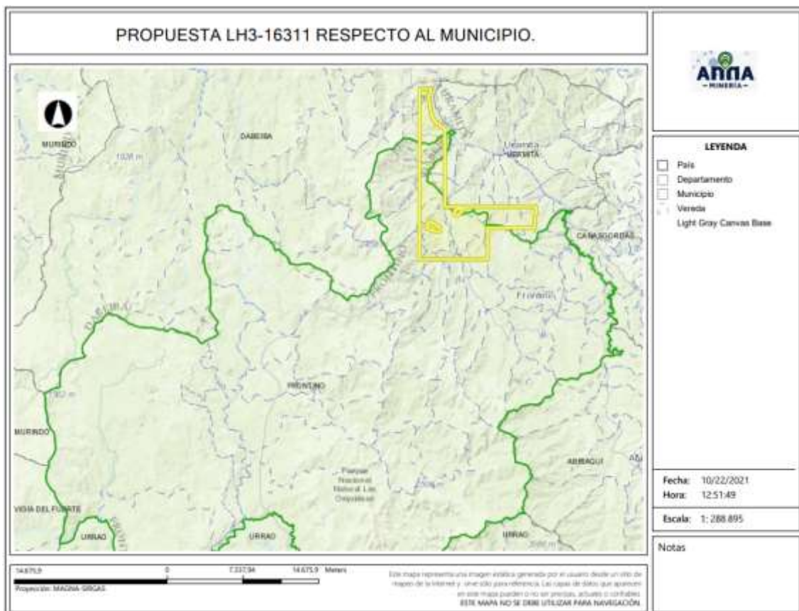
Gráfica N°2 Ubicación geográfica del área de interés

El área está ubicada en las veredas BOTON, EL ESPINAZO y DABEIBA VIEJO del municipio de DABEIBAI ; LA CAMPIÑA, EL PASO, NOBOGA, RIO VERDE, FUEMIA, PIEDRAS, SAN ANDRES, EL LLANO, LOS MONOS, EL POMA, BARRANCAS, NOBOGACITA y MURINDO del municipio de FRONTINO ; MESETA, MADERO, PALMAS, IRACAL, CALICHE, ORO BAJO, PARAMAL, OSO y RIO VERDE del municipio de URAMITA del Departamento de Antioquia , como se muestra en el gráfico N°2: