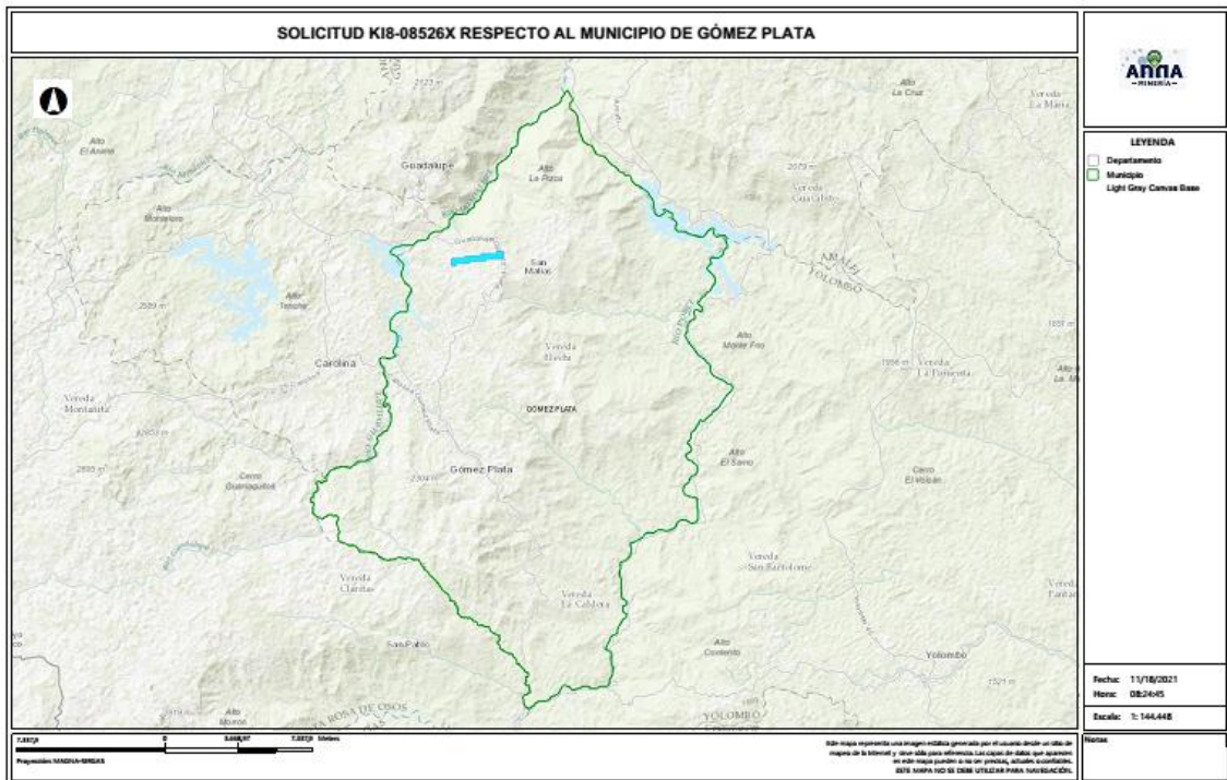
Gráfico N°2 Ubicación geográfica del área de interés

El área está ubicada en las veredas La Arenera y Cañaveral del municipio de GÓMEZ PLATA Departamento de Antioquia , como se muestra en el gráfico N°2: