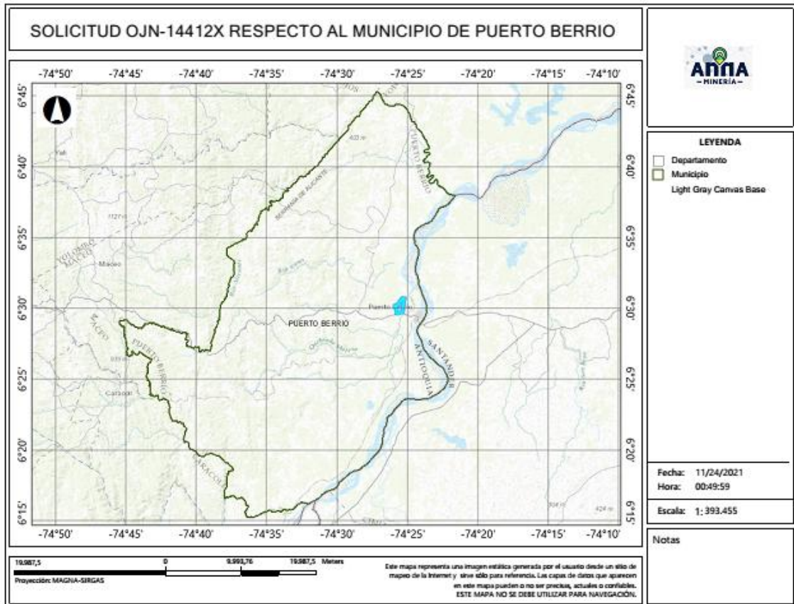
Gráfica N°2 Ubicación geográfica del área de interés

El área está ubicada en las veredas El Jardín y Grecia del municipio de PUERTO BERRÍO Departamento de Antioquia , como se muestra en el gráfico N°2: