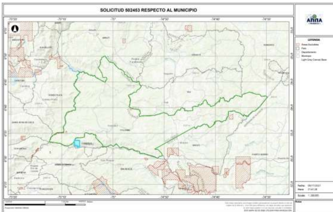
Gráfica N°2 Ubicación geográfica del área de interés

El área está ubicada en las veredas BELLA VISTA del municipio de YOLOMBO ; EL DOS, EL LIMON, BELLAVISTA y BELLA FATIMA del municipio de CISNEROS del Departamento de Antioquia , como se muestra en el gráfico N°2: